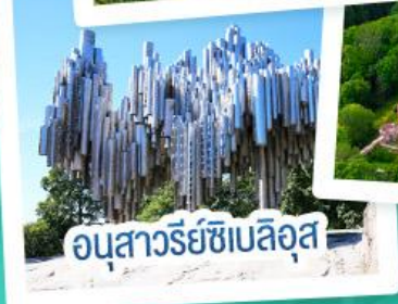
อนุสาวรีย์เซเปิลอส