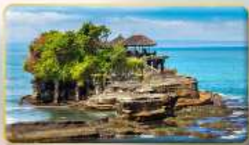
วิหารกานาห์ลือด