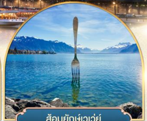
ส้อมยักษ์เวเวย์