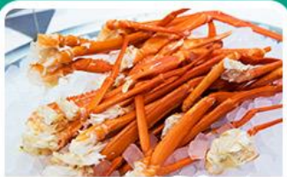
พิเศษ! บุฟเฟ่ต์ขาปู