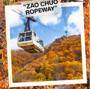
"ZAO CHUO ROPEWAY"

วันเดินทาง 30 ต.ค. - 5 พ.ย. 2569 4 - 10 พ.ย. 2569