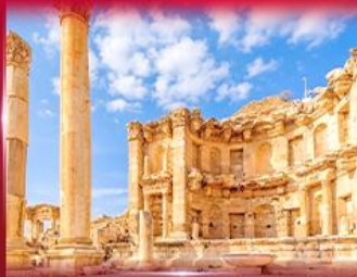
เมืองโบราณเพตรา