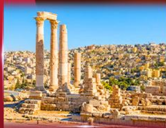
ป้อมปราการอันมาน