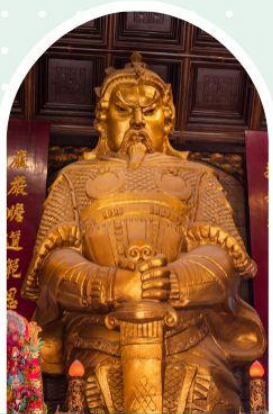
วัดเซกวง

"ไหว้พระ เสริมดวง เพิ่มสิริมงคลแก่ชีวิต"