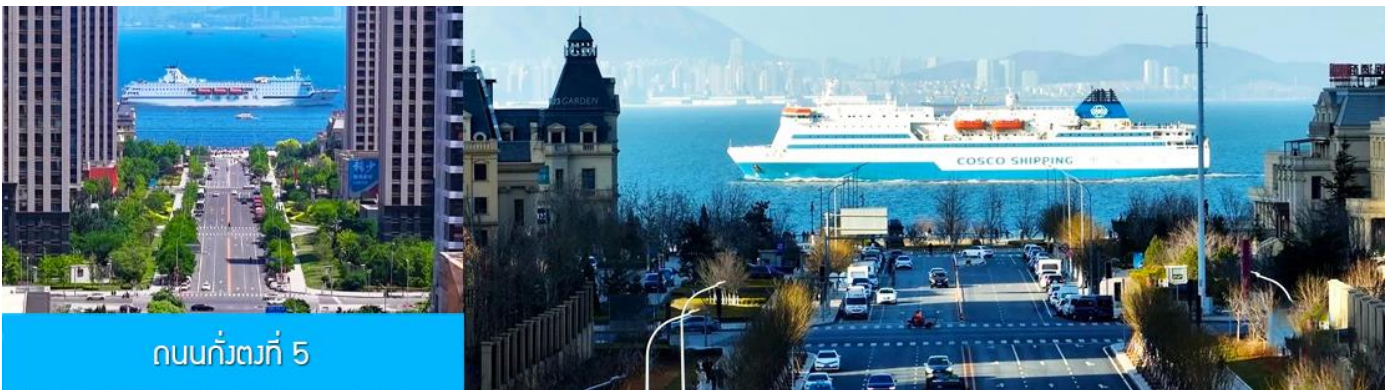
ถนนกั๋วตง 5