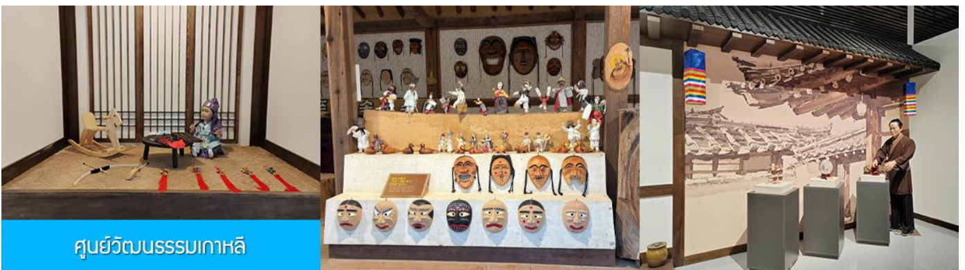
ศูนย์วัฒนธรรมเกาหลี

เช้า รับประทานอาหารเช้า ณ ห้องอาหารของโรงแรม (9)