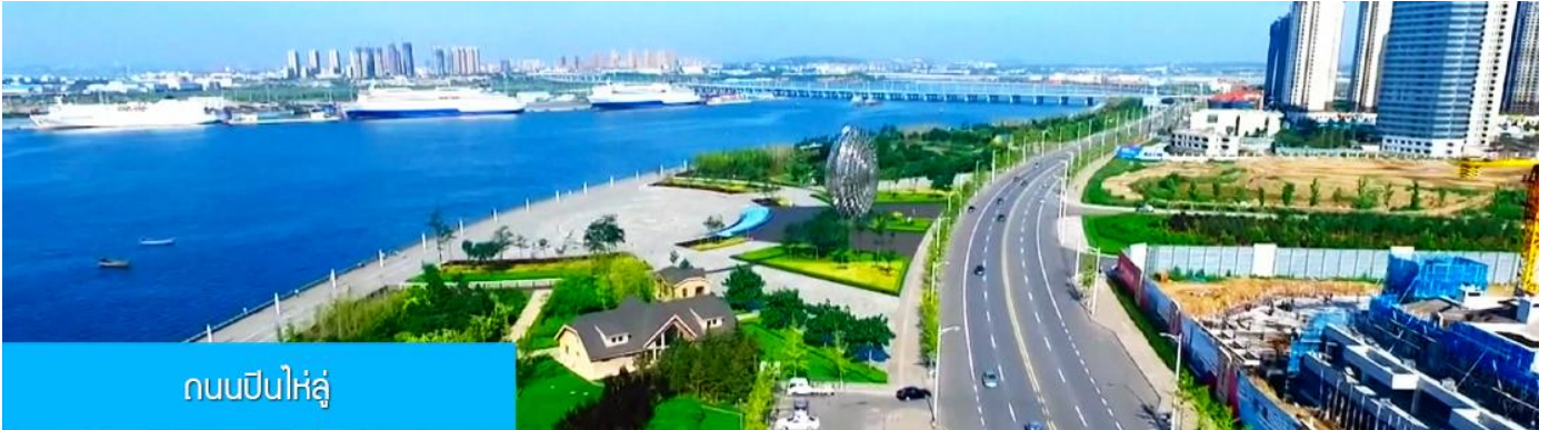
ถนนปินไห่หลู่

ล้อมด้วยตึกระฟ้าที่ทันสมัย ภายในมีบ่อน้ำพุคนตรี ลานหญ้าขนาดใหญ่ และลานกว้างสำหรับจัดกิจกรรม กลางแจ้ง อาทิ เทศกาลเบียร์นานาชาติ การแข่งขันวิ่งมาราธอน งานแฟชั่นนานาชาติเมืองต้าเหลียน ฯลฯ