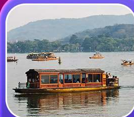
“ล่องเรือทะเลสาบซีหู”

หุบเขาเทวดาวังเซียนกู่ หมู่บ้านที่ตั้งอยู่ริมหน้าผา • หมู่บ้านโบราณหวนหลิง ป่าสนน้ำชิงซาน • ล่องเรือทะเลสาบซีหู • ถนนโบราณตุ๋นโจ้ว • ชมแสงสีที่ ฉู่หนี่โจ้ว