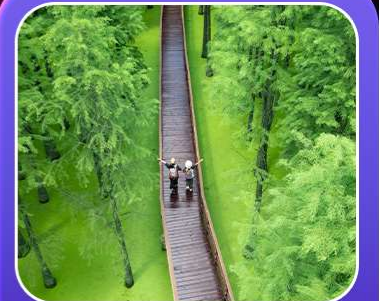
“ป่าสนชิงซาน”

T2G-HGH01GJ Welcome Hangzhou...หังโจว ฉู่โจว ฉู่หยวน ช่างเหรา หุบเขาเทวดา 5D 4N (GJ)