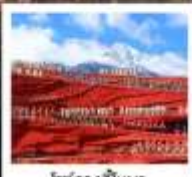
โชว์จางอีหมว

เมืองโบราณต้าหลี่ / เจดีย์สามองค์ / ไค้งร / หนลสามเอ่อไห่ / เมืองโบราณแซงกรีล่า / ซองเกนเสือกะโถด (รวมมินโถเค็อนซัน-คง) / วัดสามะชงจันหลิง (รวมท่ารถขึ้น-ลง) ชมวิวยามค่ำกินเมืองโบราณลี้เจียง / ภูเขาหิมะมังกรหยก (มังกรช้ำใหญ่) / หุบเขาพระจันทร์สีน้ำเงิน ไม้ศุ่ยเหอ (รวมรถกอล์ฟ) / โชว์จางอีหมว / เมืองโบราณไปซา นั่งรถไฟชมวิวรอบภูเขาหิมะมังกรหยก / สระมังกรดำ / คาเฟ่ไว้นดื่ม YUN DI AN CAFE (รวมค่าเครื่องดื่ม) / เมืองโบราณลี้เจียง / ถนนคนเดินจินปี้ตู้