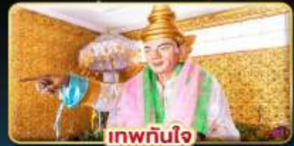
เทพกษัตรี