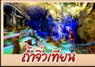
ถ้ำจิวเทียน