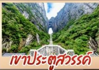
เขาประตูลสวรรค์