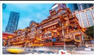
เจียงหยาดัง

อุทยานหุบหม่นป่า - อุทยานเขานางฟ้า หงหยาดัง - นั่งรถไฟทะเลสาบ - อุทยานสี่ดรุณี ป่าผิงโกว - สะพานหนานเฉียว