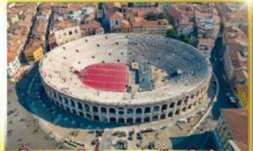
โรงละครโรมันกลางจัหวโรม่า