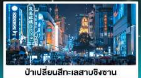
ป่าเปลี่ยนสีทะเลสาบชิงชาน