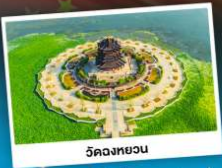
วัดคงทงวน