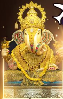
องค์ดีกษุท์เศษฐ์