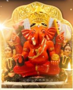
องค์สิทธินายัก