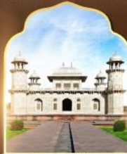
ทัชมาฮาลน้อย