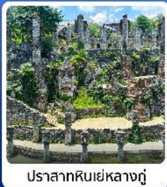
ปราสาทหินเย่หลางกู่

● ไฮไลท์ น้ำตกหวงกั๋วซู่ น้ำตกที่ใหญ่ที่สุดของจีน แหล่งท่องเที่ยวระดับ 5A ชมความสวยงาม หมู่บ้านวูเจียงจ้าย หมู่บ้านจีนโบราณ