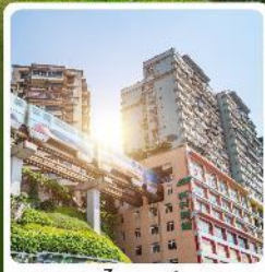
รถไฟทะลุตีง