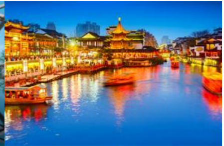
ย่านฟูจื่อเมี่ยว