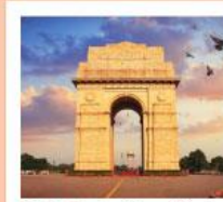
♥♥♥ India Gate