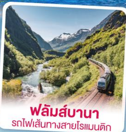
พหลิมส์บานา รถไฟเส้นทางสายโรแมนติก